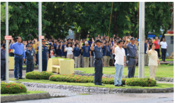
FLAG RAISING on Sept 1 kicks off the event