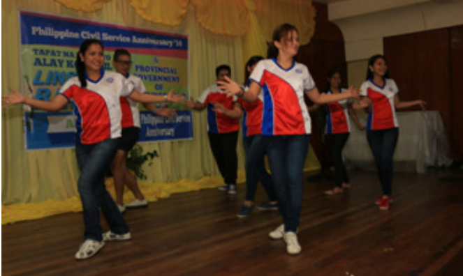
DPWH employees delight the audience with their moves during the opening program for CS month