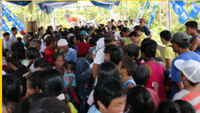
CONVERGENCE FOR PROGRESS - Inanyayahan ang mga mamamayan ng 5 barangay sa San Lorenzo Ruiz south sector upang saksihan ang pasinaya ng tulay at kalsada na alay sa kanila at upang makinabang sa mga serbisyong dala ng multi-services caravan.