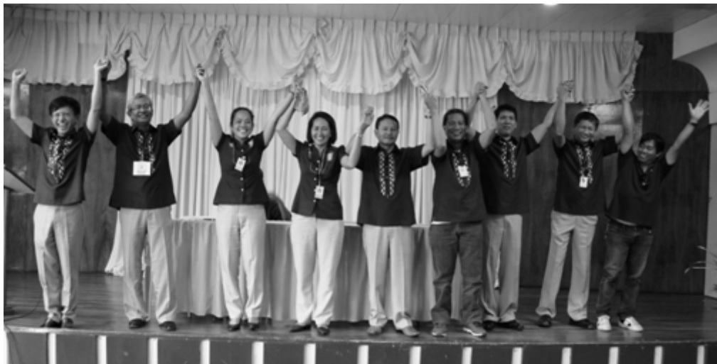
HURRAY! FOR THE NEWLY ELECTED OFFICERS OF PROVINCIAL GOVERNMENT EMPLOYEES WELFARE ASSOCIATION (PG-EWA)

Ang CNPG EWA ang magiging kapulungan ng mga kawani upang mapag-usapan at mapag-aralan ang mga bagay na makabubuti sa mga kawani na may kinalaman sa kanilang trabaho at maipaabot ito sa mga hepe ng tanggapan, sa sanggunian gayundin sa punong ehekutibo.