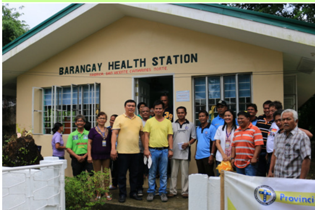
Hunyo 5, 2014 - San Vicente, Camarines Norte - Nagsagawa ng espesyal na iskedyul ng multi-services caravan sa barangay Fabrica kasabay ng pasinaya at turn-over ng proyektong barangay health station ng pamahalaang panlalawigan para sa mga mamamayan doon. Si Gob. Egay Tallado at Mayor Francis Ong (parehong nakadilaw na T-shirt) kasama ang iba pang mga opisyaes ng bayan at barangay at mga namamahala ng nasabing pasilidad.