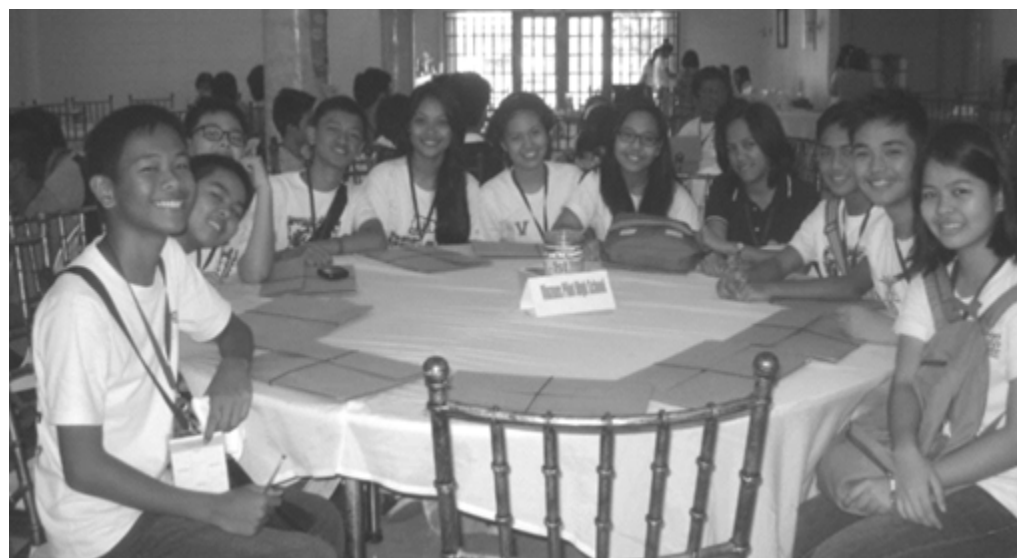
Some of the youth who participated in the 1st Health-Related Youth Congress.