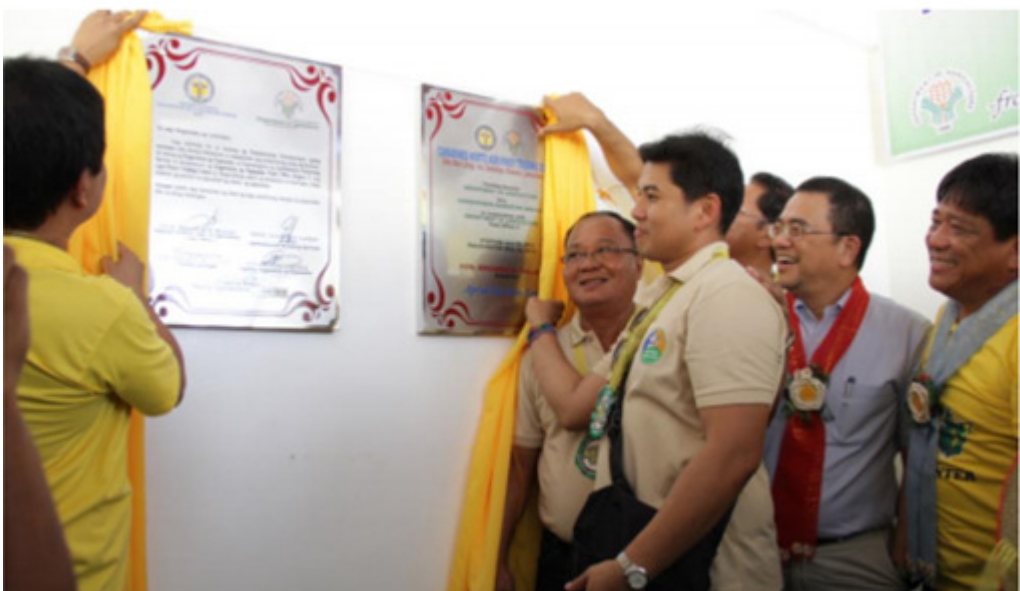
Unveiling of Markers ng Camarines Norte Agri-Pinoy Trading Center. Nasusulat sa kaliwang marker ang pag-aalay ng APTC sa mga magsasaka ng Camarines Norte samantalang ang kanang marker ay nagpapahayag ng pasasalamat ng Pamahalaang Panlalawigan kay Pangulong Aquino at sa Kagawaran ng Agrikultura dahil sa pagkakaloob ng pondo para sa proyektong APTC