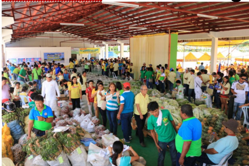
Kasabay ng pasinaya ng APTC ay ang pagsisimula ng kalakalan na pinamahalaan ng mga opisyal at kawani ng Office of the Provincial Agriculturist. Ikinatuwa naman ng mga namili ang murang presyo ng mga sariwang gulay at prutas.