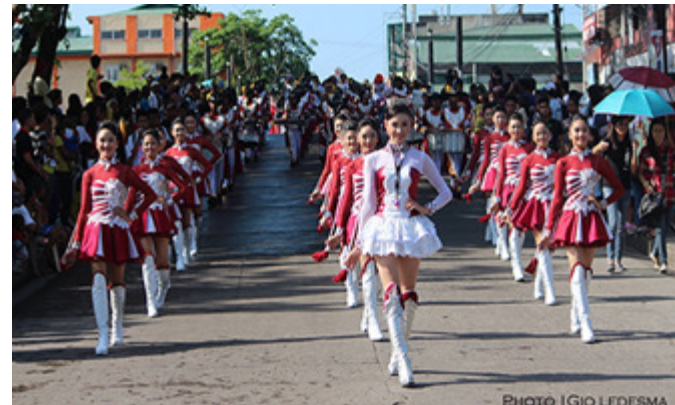
THE WINNER TAKES IT ALL - Ang Abaño Laboratory High School ang nanalo sa DLC Competition-High School Division at nakuha din nila ang ang Best in Majorette at Best Conductor titles. Naiwi ng Capalonga HS ang 2nd place title habang ang 3rd place slot ay nasungkit naman ng Camarines Norte National High School.