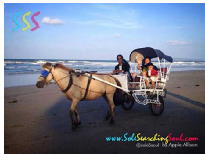
KALESA RIDE AT BAGASBAS BEACH SHORE – ito'y isang atraksyon at kinagigiliwan ng mga turista sa Bagasbas, Daet Camarines Norte