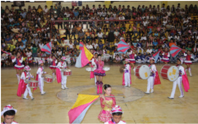
FIRST PLACER- Ang Daet Elem. School DLC sa kanilang eksibisyon sa DLC Competition-Elementary Division. Nagmula din sa kanila ang Best Conductor title. Nakuha ng Mercedes Elem. School ang 2nd place at ang Tulay na Lupa Elem. School na 3rd place ay nakuha din ang ang Best in Majorette title.