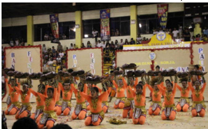
Sta. Elena PALAYOG Festival - 1st Runner-Up

Ang mga kalahok sa kumpetisyon ay binigyang-puntos na ng mga hurado habang nagpa- (Sundan sa pahina 6)