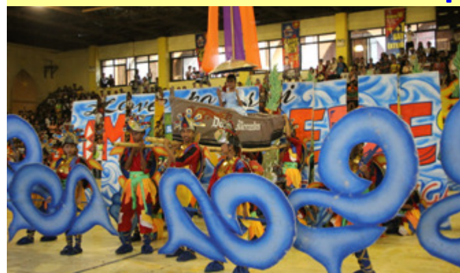
Mercedes KADAGATAN Festival - 2nd Runner-Up