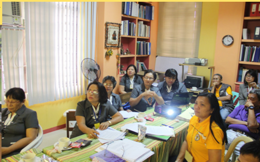
APTC MALAPIT NA! – Ang mga itinalagang kawani mula sa iba't-ibang tanggapan ng Pamahalaang Panlalawigan para mag-repaso ng Agri-Pinoy Trading Center (APTC) Operations Manual na kanilang binabasa sa wide screen. Ang nasabing manual ang siyang magiging gabay sa pamamalakad ng APTC na malapit nang pasinayaan.