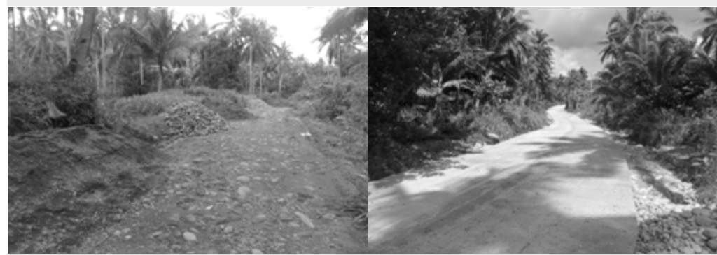
Concreting of Maot FMR, Brgy. Maot, Labo