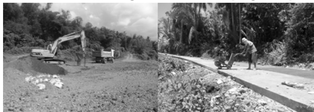
Concreting of Farm to Market Road, Brgy. Submakin, Labo