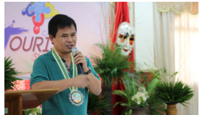
Isang kumprehensibong Provincial Tourism Action Plan ang ating kailangan, bigkas ni Gob. Tallado .