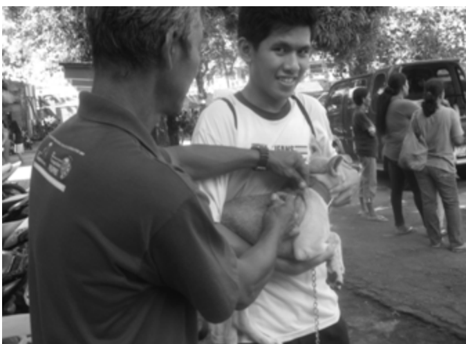
Regular na gawain ng Provincial Veterinary Office ang pagbabakuna sa mga aso. Sila ay sumasama sa multi-services caravan para magbakuna ng aso sa mga barangay na pinupuntahan tulad ng nasa larawang ito na kuha sa Barangay 1, Daet .

Interesadong nakikinig ang mga participants sa pagpapaliwanag ukol sa pagproseso ng mga basurang nabubulok mula sa dumpsites upang gawing pataba sa pananim.