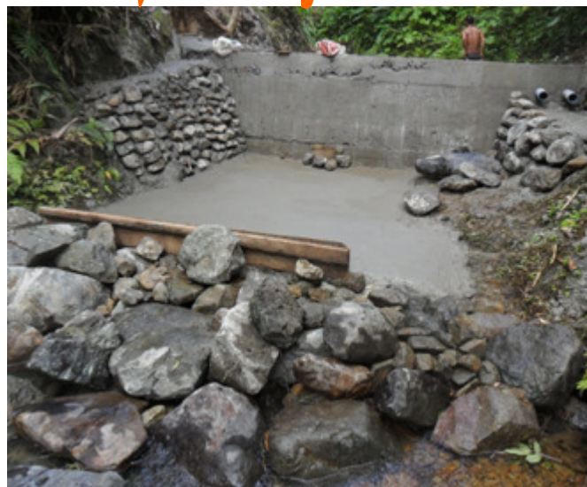
Improvement of Water Supply System from Level 1 to Level 2, Brgy. Guisican, Labo