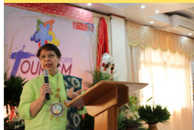
Si dating Department of Tourism (DOT) Secretary Mina Gabor na isa sa mga tagapagsalita sa Tourism Summit na kamakailan ay nandito rin sa lalawigan at dumalo sa Farm Tourism Congress.