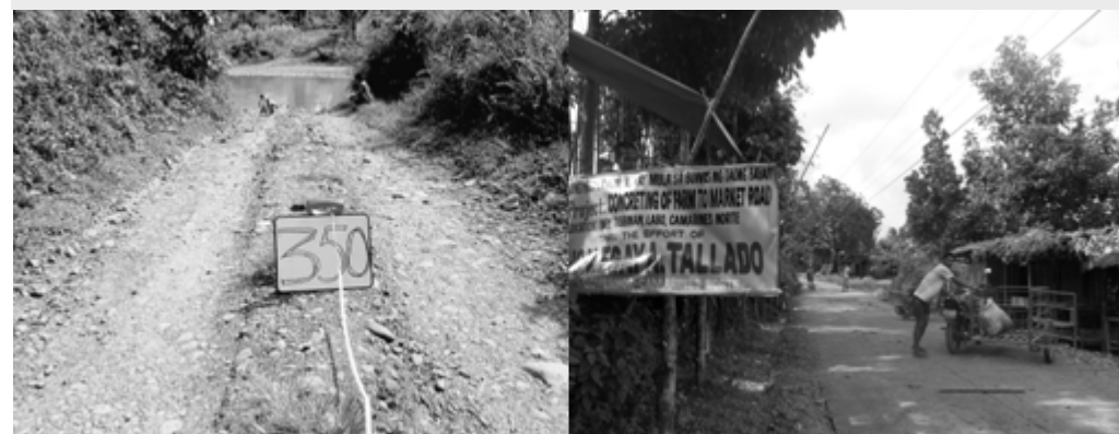
Concreting of Tigbinan Farm-to-Market Road, Brgy. Tigbinan, Labo