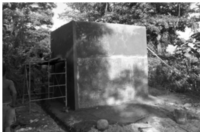
Improvement of Water Supply System from Level 1 to Level 2, Brgy. Masalong, Labo

get areas ng OPAPP-PAMANA na may "peace agreement, conflict-affected and vulnerable communities" at dito sa Camarines Norte ay kabilang ang bayan ng Labo partikular ang mga barangay na nabanggit. LORENA DELA TORRE-IBASCO