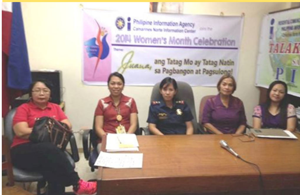
Ang mga resource speakers sa Talakayang isinagawa ng PIA para sa panlalawigang selebrasyon dito ng Buwan ng Kababaihan.