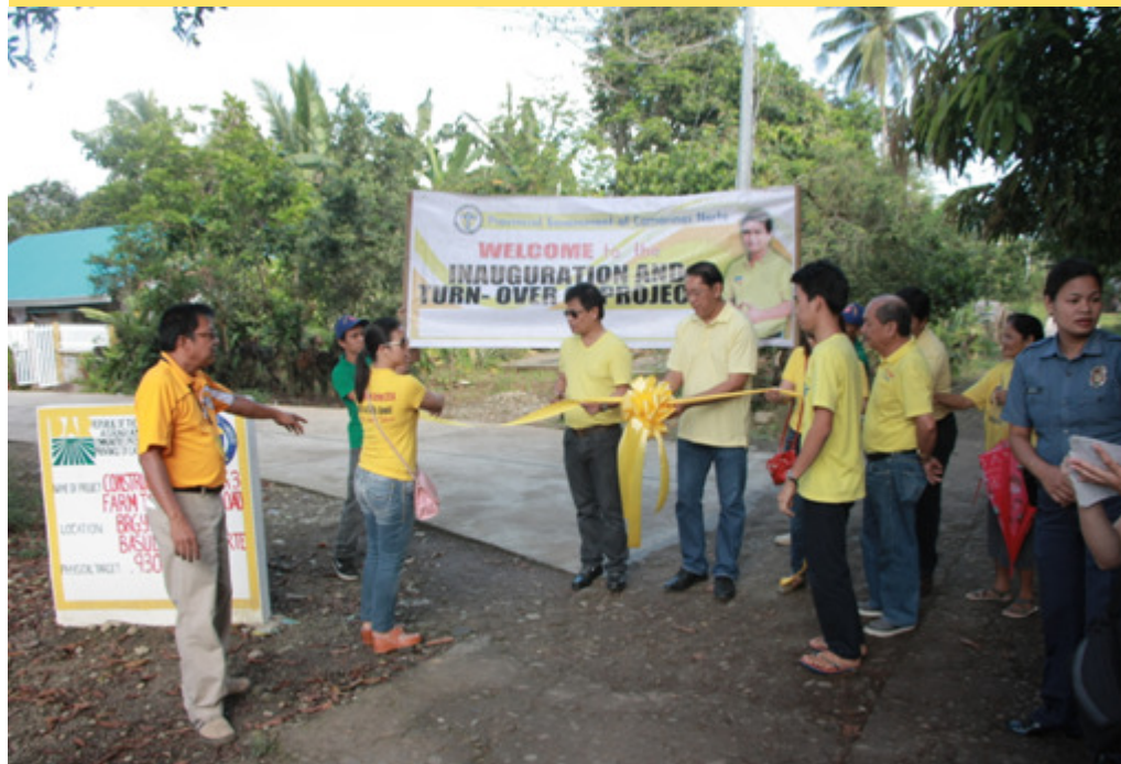
Sa pagtungo ng multi-services caravan ng kapitolyo sa Brgy. San Felipe, Basud ay isinabay ang pasinaya ng proyektong construction of Purok 3 farm to market road sa ilalim ng pagtutulungan ng Pamahalaang Panlalawigan at ng Department of Agrarian Reform.