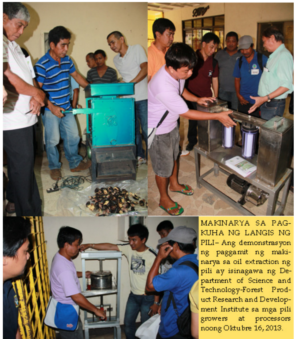
MAKINARYA SA PAG-KUHA NG LANGIS NG PILI — Ang demonstrasyon ng paggamit ng makinarya sa oil extraction ng pili ay isinagawa ng Department of Science and Technology-Forest Product Research and Development Institute sa mga pili growers at processors noong Oktubre 16, 2013.

Pinangunahan ng DOST at OPAg ang makahulugang pagpupulong na dinaluhan ng mga pili growers at processors mula sa iba't ibang bayan ng lalawigan, ng mga kinatawan mula sa Camarines Norte Pili Growers Association, mula rin sa Provincial Offices ng Department of Environment and Natural Resources at Department of Trade and Industry. MELINDA L. JEREZ/lorena dt ibasco/jcalimlim