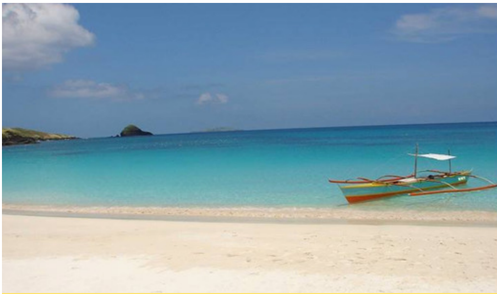
CALAGUAS ISLANDS — Unang napabilang sa 25 emerging tourist destinations sa Pilipinas at ngayon ay siguradong pasok na sa Top 10 Philippines Gems via online voting.