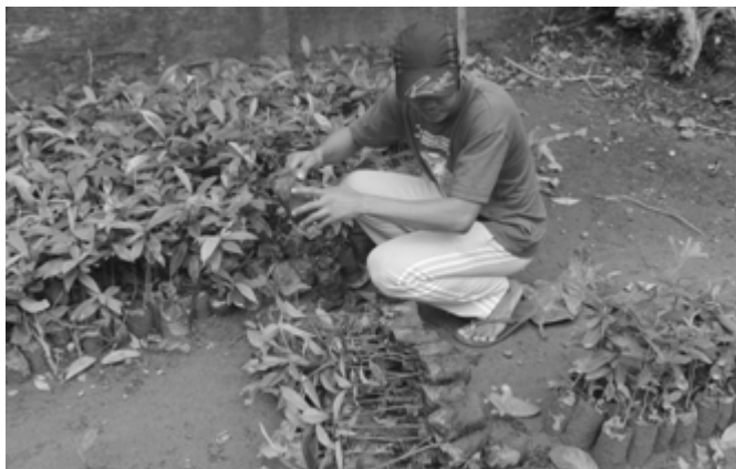
Ang mga forestry seedlings ay inaalagaan sa provincial nursery at regular ang pamamahagi ng mga ito para sa patuloy na pagsusulong ng Reforestation Program ng Pamahalaang Panlalawigan ng Camarines Norte.