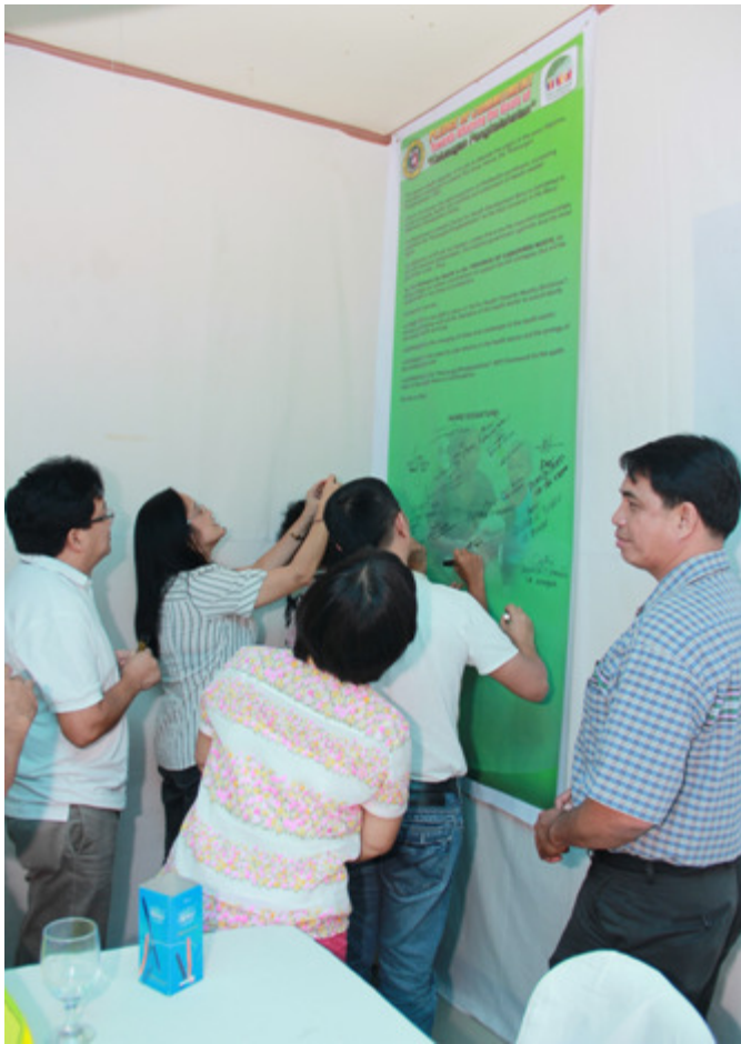
LAGDA NG PANGAKO- Pumipirma ang mga Municipal Health Officers sa Pledge of Commitment Towards Attaining the Goals of "Kalusugang Pangkalahatan". Isa ito sa naging tampok na gawain sa isinagawang Provincial health Summit noong Agosto 22 sa New Bel-Air Resort Daet.

N aging mabunga at hitik sa kooperasyon ang isinagawang Provincial Health Summit sa Camarines Norte noong Agosto 27, 2013 sa New Bel-Air Resort Daet na una sa serye ng health summit na isinasagawa sa Rehiyong Bikol ng Department of Health-Center for Health Development Bicol (DOH-CHD Bicol).