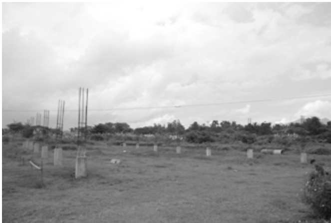
ON-GOING CONSTRUCTION ng Covered Court sa Mat-i Vinzons kung saan matatagpuan ang Sentrong Kaligtasan. Ang pasilidad na ito ay magiging lugar para sa mga pagsasanay sa DRRM