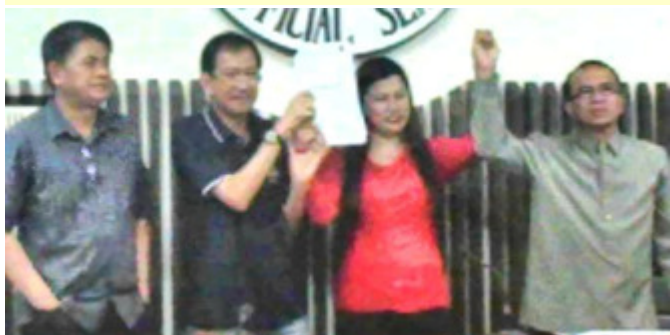
Ang proklamasyon ng bagong halal na 1st District Congressman, Catherine B. Reyes na may botong 52, 091