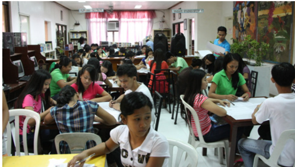
Kuha ang larawan sa provincial library na isa sa lugar ng isinagawang pagsusulit sa mga aplikante ng Provincial Government College Education Assistance Program

Samantala ang mga iskolars ng PGCEAP ay yaong may pinakamataas na puntos batay sa pinagsamang grado nila sa dalawang magkahiwalay na eksaminasyon at ang kanilang general weighted average ay matataas. Ang mga valedictorians at salutatorians mula sa mga secondary schools sa Camarines Norte ay awtomatikong scholars sa ilalim ng PGCEAP.