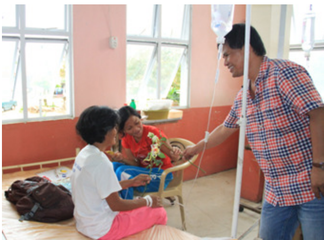
Iniaabot ni Gob. Tallado ang bulaklak sa 2 pasyente sa CNPH

Mula doon ay dumeretso sila ng provincial hospital at namigay din ng rosas sa mga pasyente. Nasorpresa sila dahil hindi nila akalain ang pagdalaw ng gobernador at binigyan kasiyahan sila sa araw ng mga puso. j@c