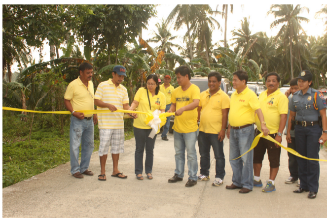
BASIAD, STA.ELENA PROV'L ROAD