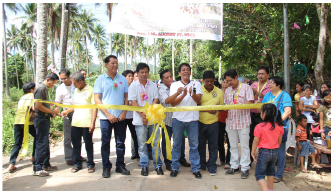
STA. ROSA SUR-SAN RAFAEL FMR JOSE PANGANIBAN