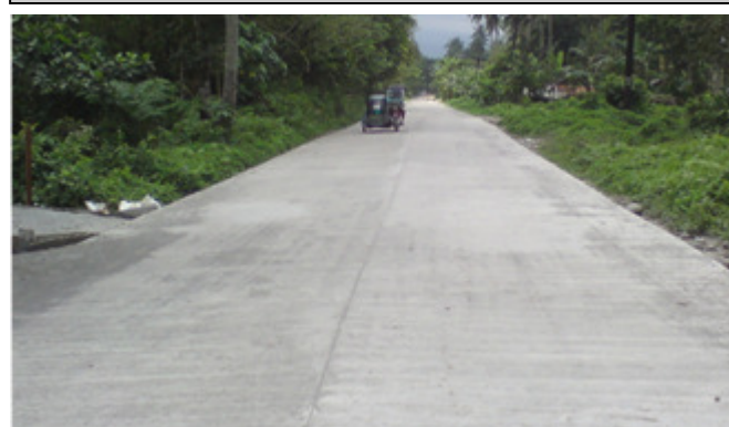
Concreting of Tulay na Lupa- Labo, Provincial Road