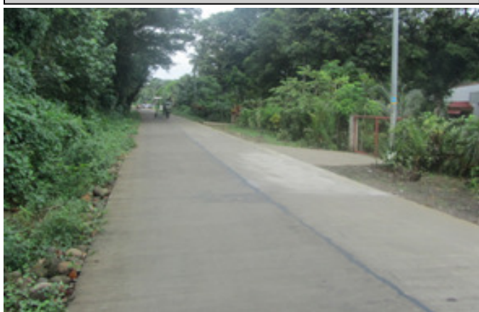
DAET-SAN VICENTE PROV'L ROAD