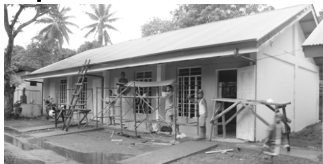
Construction of 2 classroom building sa San Isidro Talisay na may pondong P 1.9 milyon na nahingi ni Gob. Tallado kay Sen. Ralph Recto