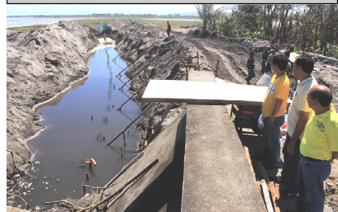
CORY AQUINO BLVD going to Mercedes