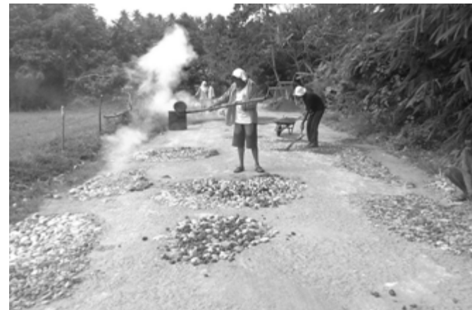
On-going REHABILITATION OF MANGCAMAGONG-LANOT ROAD, MERCEDES