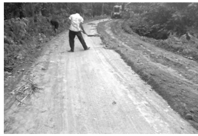
On-going REHABILITATION OF SAN FELIPE-GUINATUNGAN PATAG PROVL ROAD (BASUD)