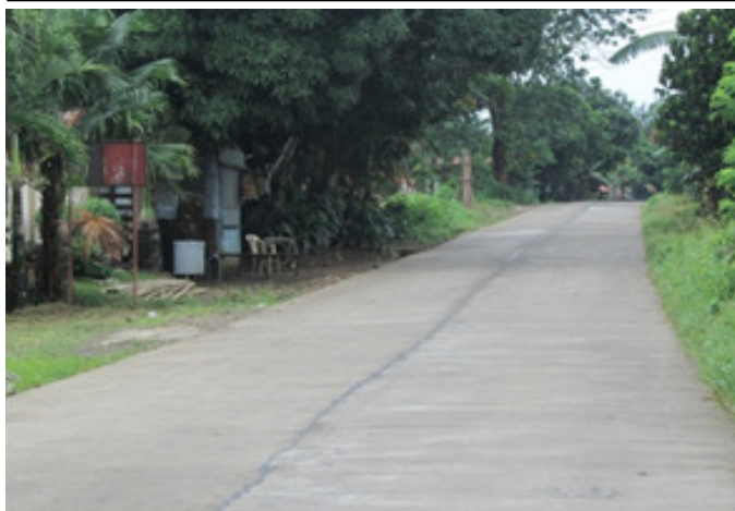
DAET-SAN LORENZO RUIZ PROV'L ROAD