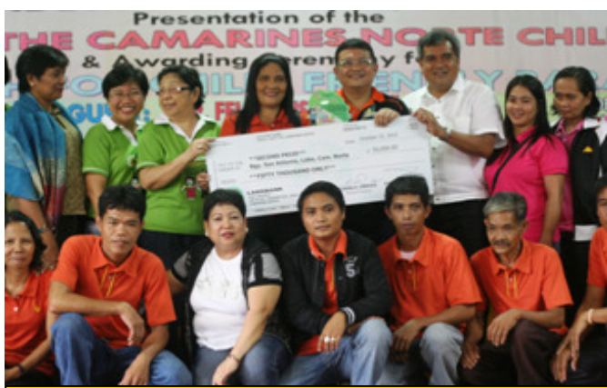
2ND PLACE – Barangay San Antonio, Labo Prizes of P50,000.00 at trophy