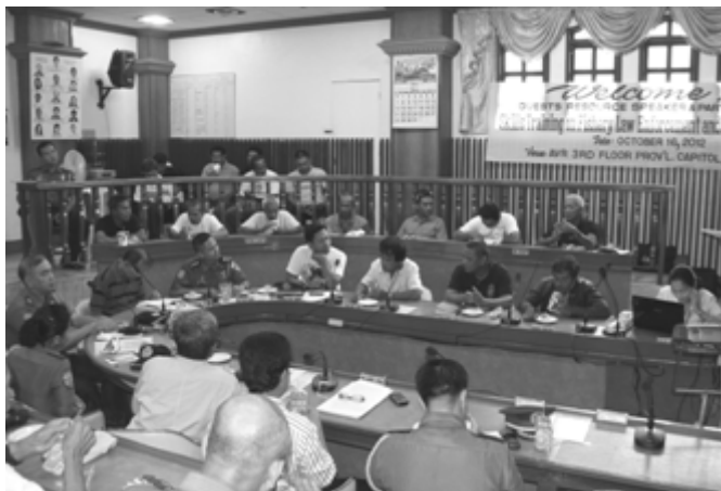
Forum Fishery Laws and Other Related Environmental Laws held at Session Hall, Provincial Capitol