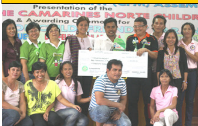
4TH PLACE Barangay Salvacion, Jose Panganiban Prizes of P20,000.00 at trophy