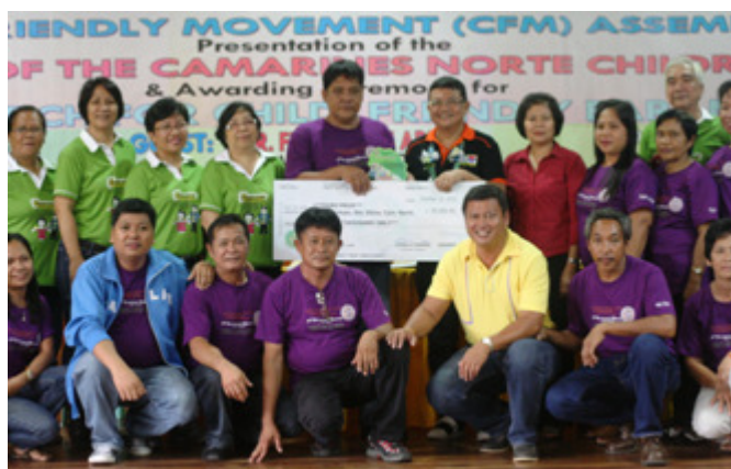
3RD PLACE – Barangay Kabuluhan, Sta. Elena P30,000.00 cash at trophy