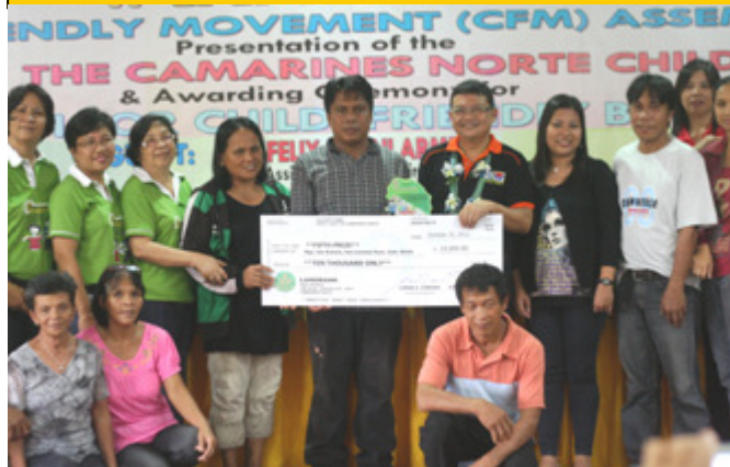
5TH PLACE- Barangay San Ramon, San Lorenzo Ruiz Prizes of P10,000.00 at trophy