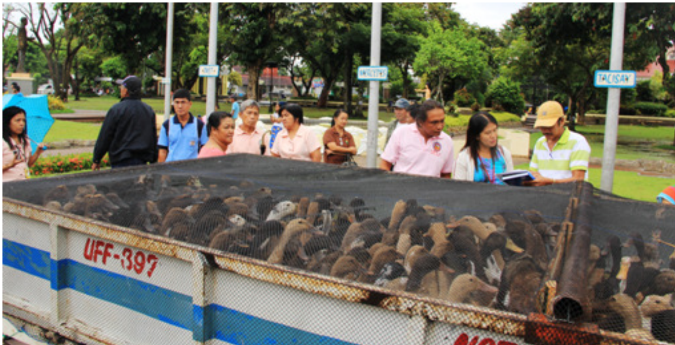
Ang ilan sa 1100 na mga itik na ipinamahagi sa 22 benepisaryo mula sa ibat ibang bayan sa ilalim ng Poultry Rehab Program ng Pamahalaang Panlalawigan ng Camarines Norte