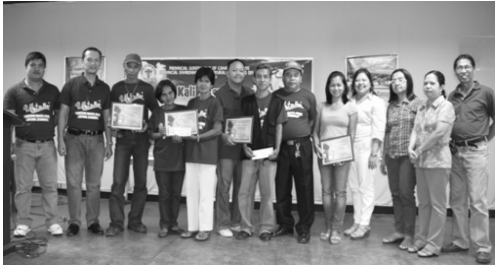
Ang mga nagwagi sa KKK patimpalak kasama ang ilang opisyal at kawani ng pamahalaang panlalawigan at pamahalaang nayonal.