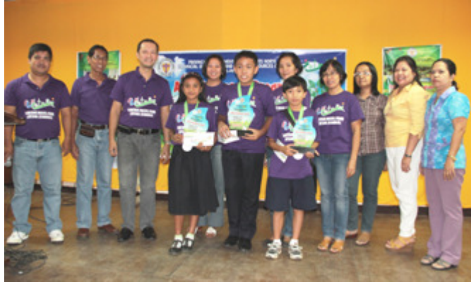
Ang mga nagwagi sa Essay Writing at Oratorical Contests kasama ang mga hurado at mga kawani ng PG PENRO