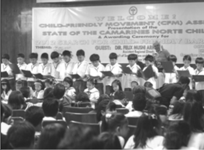
Mary's Bright Montessori School of Daet

T hree-in-One (3-in-) ika nga ang ginanap na programa noong Oktubre 25, ng umaga sa Little Theater ng Kapitolyo Probinsyal para sa pagsasara ng selebrasyon dito ng 20 th National Children's Month ngayong Oktubre 2012. Ito ay kabibilangan ng Child-Friendly Movement (CFM) Assembly, Presentation of the State of the Camarines Norte Children (PSCNCR), at ang awarding ceremony para sa 2012 Child-Friendly Barangay.