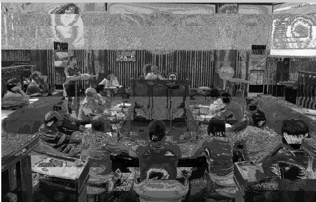
Ang pagpupulong ng Provincial Peace and Order Council noong ika-27 ng Hunyo 2012 kung saan tinalagay ang pagbuo ng PAMANA Technical Working Group