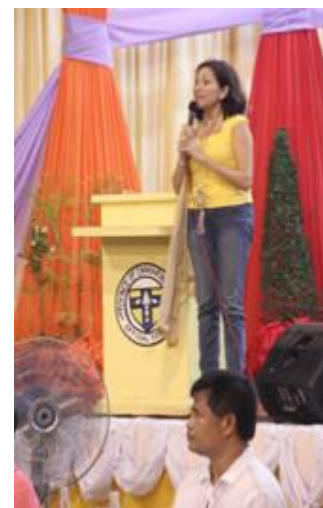
Si. Congresswoman Riza Hontiveros Baraquel ng AK-BAYAN Party List