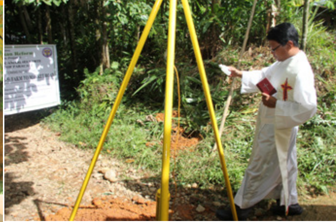
Mga larawan ng ground breaking ceremony ng FMR