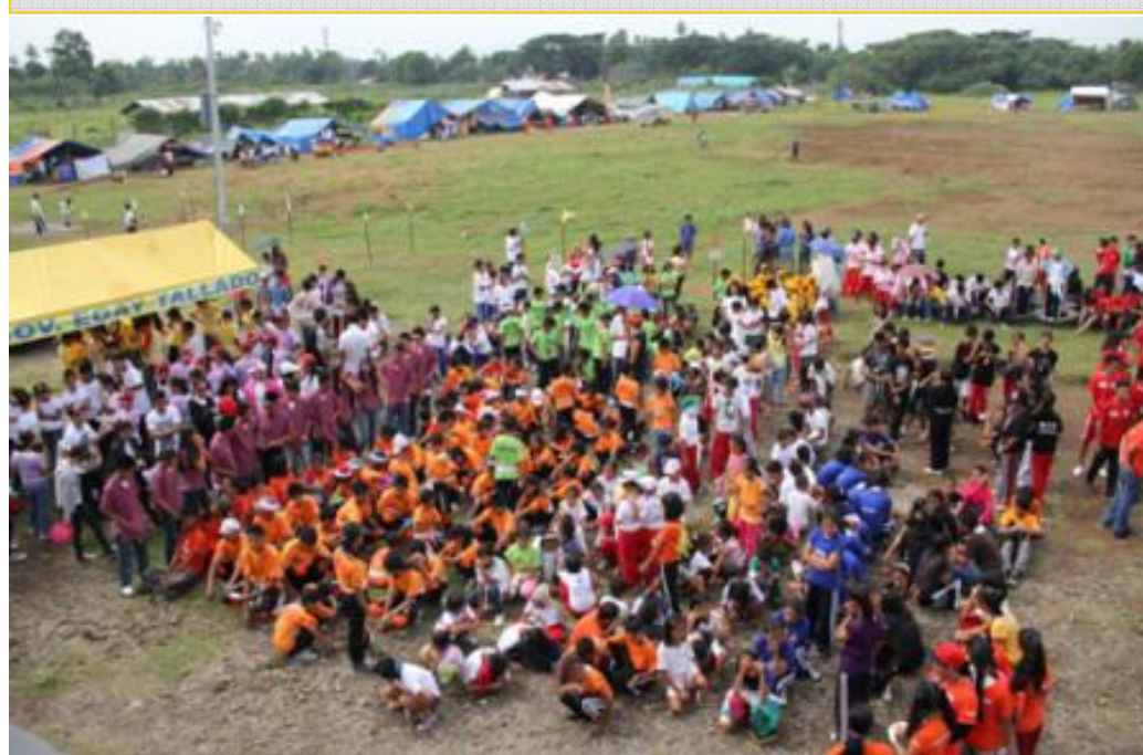
Nasa larawan sa itaas ang lumahok na 1,704 kabataan at adult responders at ang iba pang larawan na nagpapakita ng mga isinagawang umpetisyon. Sa larawan sa dulong kanan ay ang mga kawani ng PDDDDRO na siyang namahala ng PDRR Skills Olympics