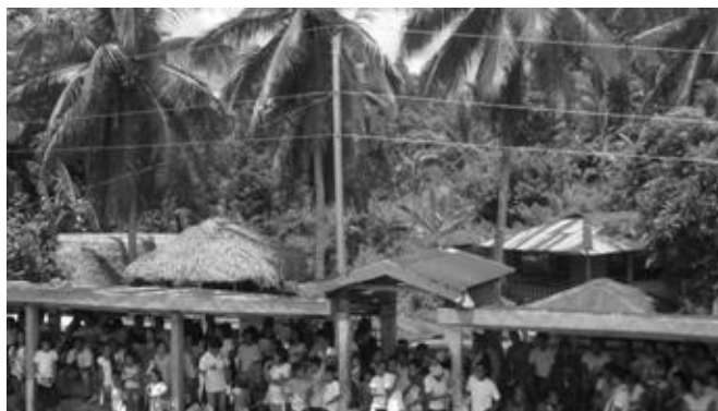
Ang linya ng kuryente sa Pag-Asa, Labo at ang mga mamamayan na matagal nang inasam ito.