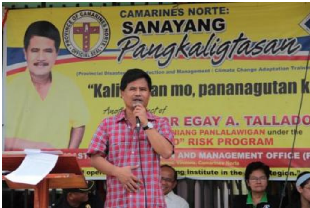
"Nais ko na mapaunlad ang kamalayan ng publiko sa mga angkop na pag-aksyon sa iba't-ibang kalamidad at sitwasyong pang-emerhensya", sabi ni ni Gob. Tallado