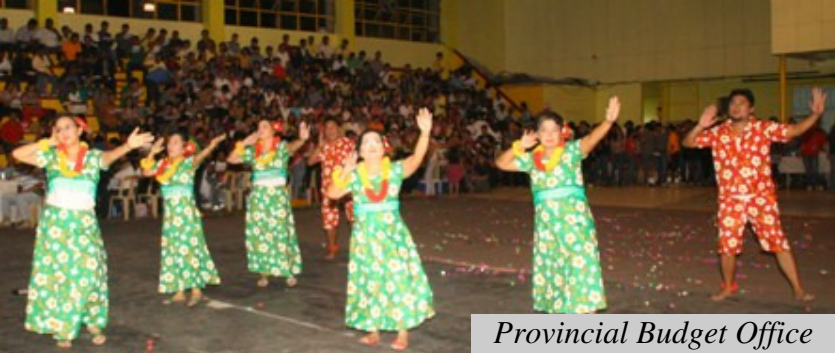
Provincial Budget Office