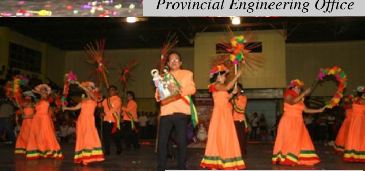
Provincial Health Office