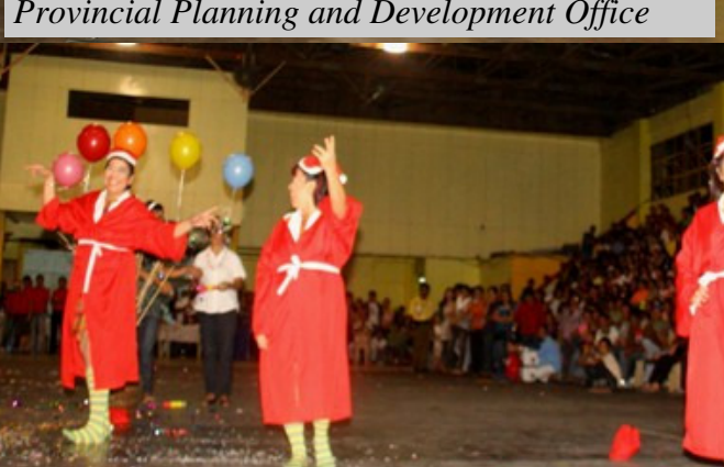
Provincial Planning and Development Office