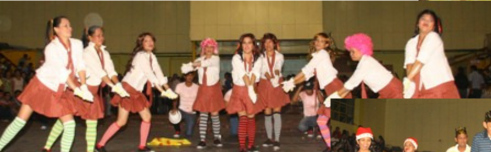
Office of the Secretary to the Sangguniang Panlalawigan