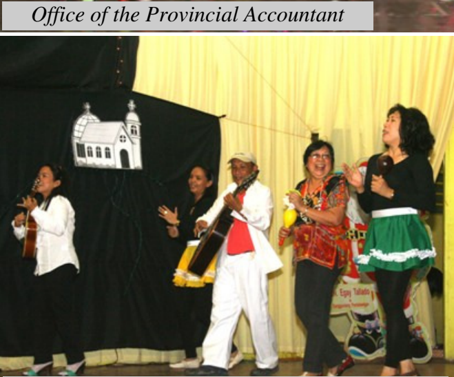
Office of the Provincial Accountant