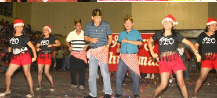
Provincial Engineering Office