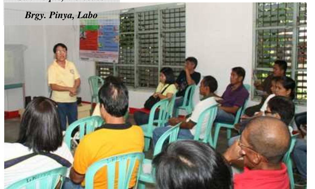
Brgy. Pinya, Labo