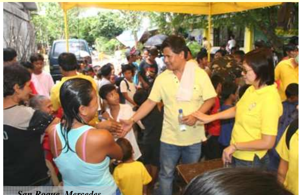
San Roque, Mercedes