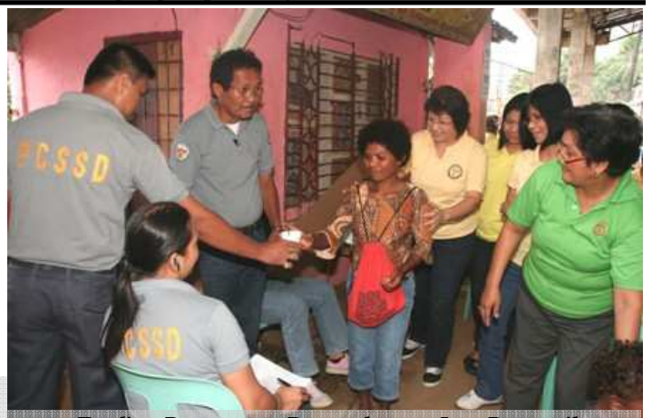
Feeding Program sa Bagongbayan, Jose Panganiban