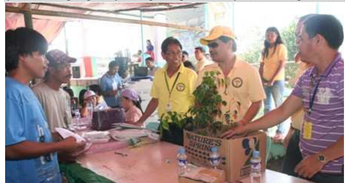
Pamamahagi ng Tree Seedlings sa Larap, Jose Panganiban