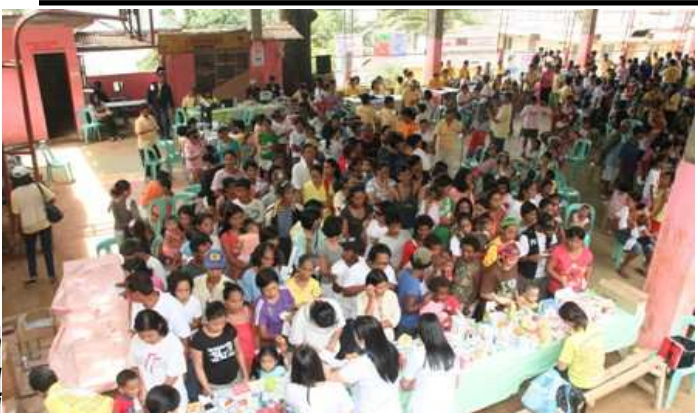
Pagbibigay ng libreng gamot, bitamina at check-up sa mga benepisyaryo ng caravan sa Bagongbayan, Jose Panganiban.