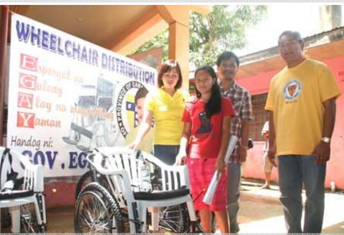
Pamamahagi ng wheelchair sa Bagongbayan, Jose Panganiban