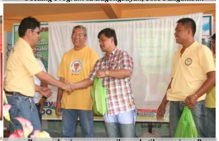
Pamamahagi ng mga semilyang butil ng mais sa Brgy. Bagongbayan, Jose Panganiban.