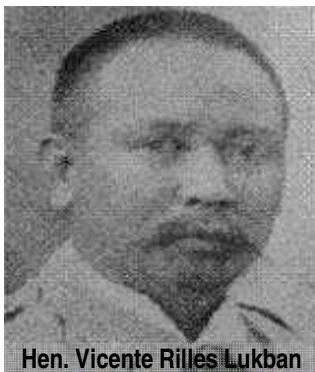
Hen. Vicente Rilles Lukban