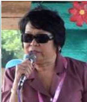
Cecilia Capadocia-Yangco DSWD Undersecretary