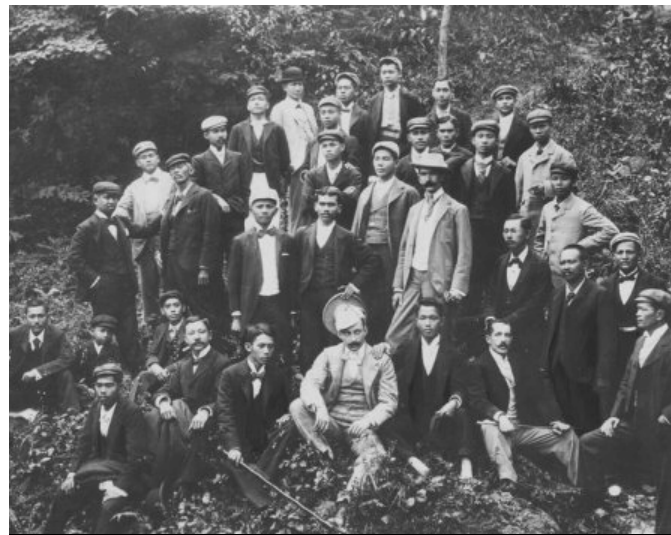
Si Heneral Vicente Lukban kasama ang mga Rebolusyonaryong ipinatapon sa Hongkong, 1898

Dahil dito, ipinasa naman ng SP ang Resolution No. 048-11 - "A Resolution Giving Force and Effect to the Agreement Among the Con-