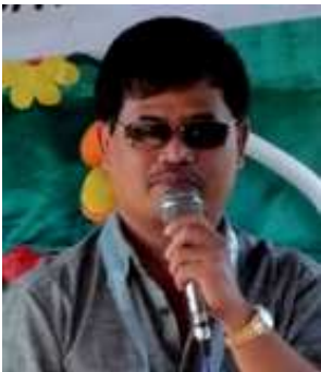
Edgardo A. Tallado Governor