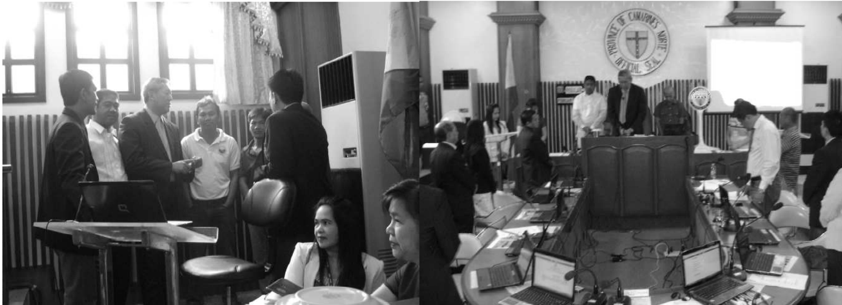
Ang Joint Session na ginanap sa pagitan ng Sangguniang Panlalawigan at mga Sangguniang Bayan ng Labo at Paracale kung saan ito ay ginanap sa Session Hall ng Sangguniang Panlalawigan dito sa Kapitolyo Probinsyal. Ito ay naglalayong maresolba ang ilang isyu ukol sa boundary dispute ng Awitan, Labo at Awitan, Paracale.