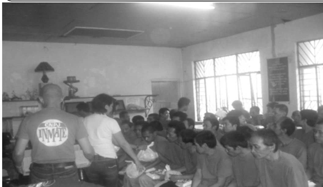
Ang gift-giving activities na isinagawa sa Camarines Norte Provincial Jail ng iba't ibang paaralan at ilang tanggapan at mga non-government organizations dito sa lalawigan bilang pakikiisa sa pamahalaang panlalawigan sa pagdiriwang ng araw ng kapaskuhan dito.

Positibo namang tumugon dito ang mga pampamahalaan ng tanggapan na nagbigay ng mga sabon, shampoo , toothpaste , noodles , sardinas, bigas, at damit para sa mga nakapiit sa CNPJ. Kasunod nito, ipinaabot ng pamunuan ng CNPJ ang pasasalamat nito sa mga sumusunod na sumuporta sa kanilang inisyatibo: Sangguniang Panlalawigan (SP), Provincial Veterinary Office (PROVET) , Ecosystem and Environmental Resource Management Division