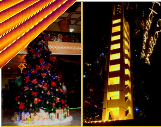
Ang higanteng Christmas tree sa loob ng lobby ng kapitolyo na bahagi ng light-a-tree project ni Gob. Egay Tallado at ang isa sa mga kalahok rito ay ang replica ng tower ng Mabini Colleges na binuo ng mga mag-aaral at kawani ng nasabing paaralan.