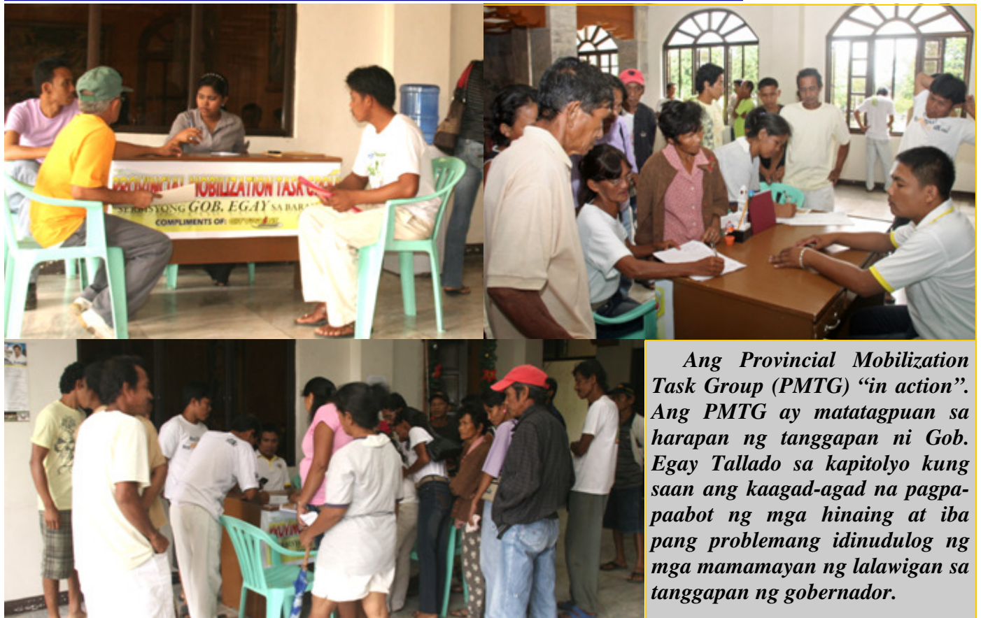
Ang Provincial Mobilization Task Group (PMTG) "in action". Ang PMTG ay matatagpuan sa harapan ng tanggapan ni Gob. Egay Tallado sa kapitolyo kung saan ang kaagad-agad na pagpaabot ng mga hinaing at iba pang problemang idinudulog ng mga mamamayan ng lalawigan sa tanggapan ng gobernador.

nasa loob EDITORIAL 4 TRAVELLER'S BLOG 5