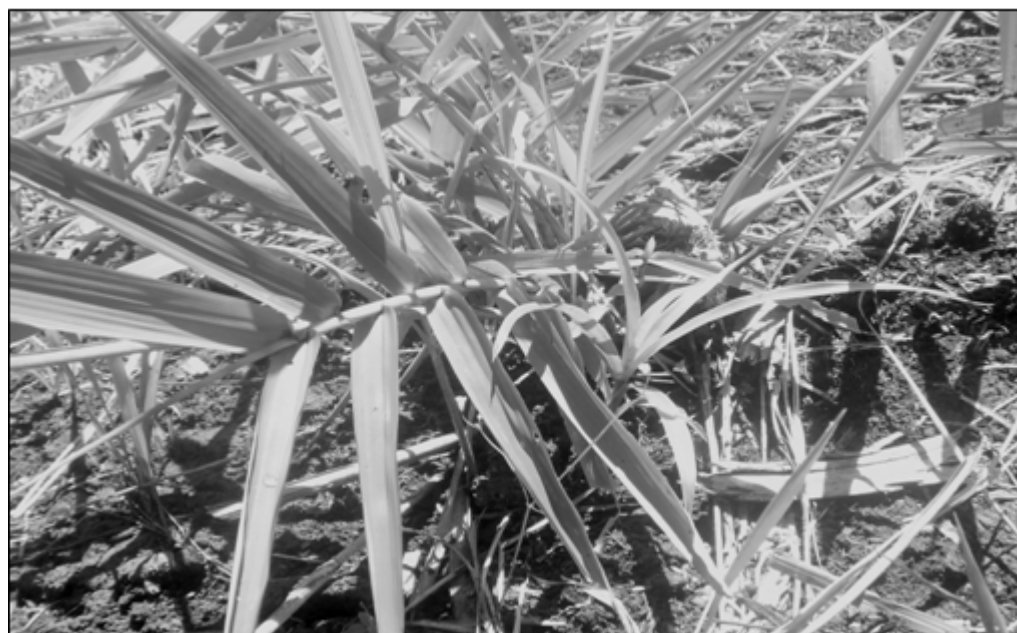
Pamahalaang Panlalawigan sa pamamagitan ng Ecosystem and

Environment Resource Management Division-Office of the Governor