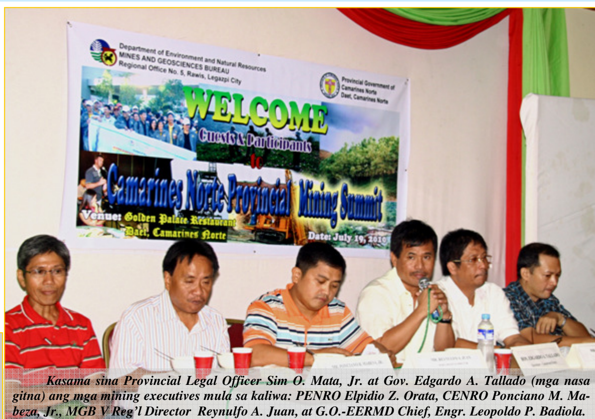
Ang Mining Summit na isinagawa sa Golden Palace Restaurant na binuo ng MGB at pamahalaang panlalawigan sa pangu nguna ni Gob. Egay A. Tallado na dinaluhan