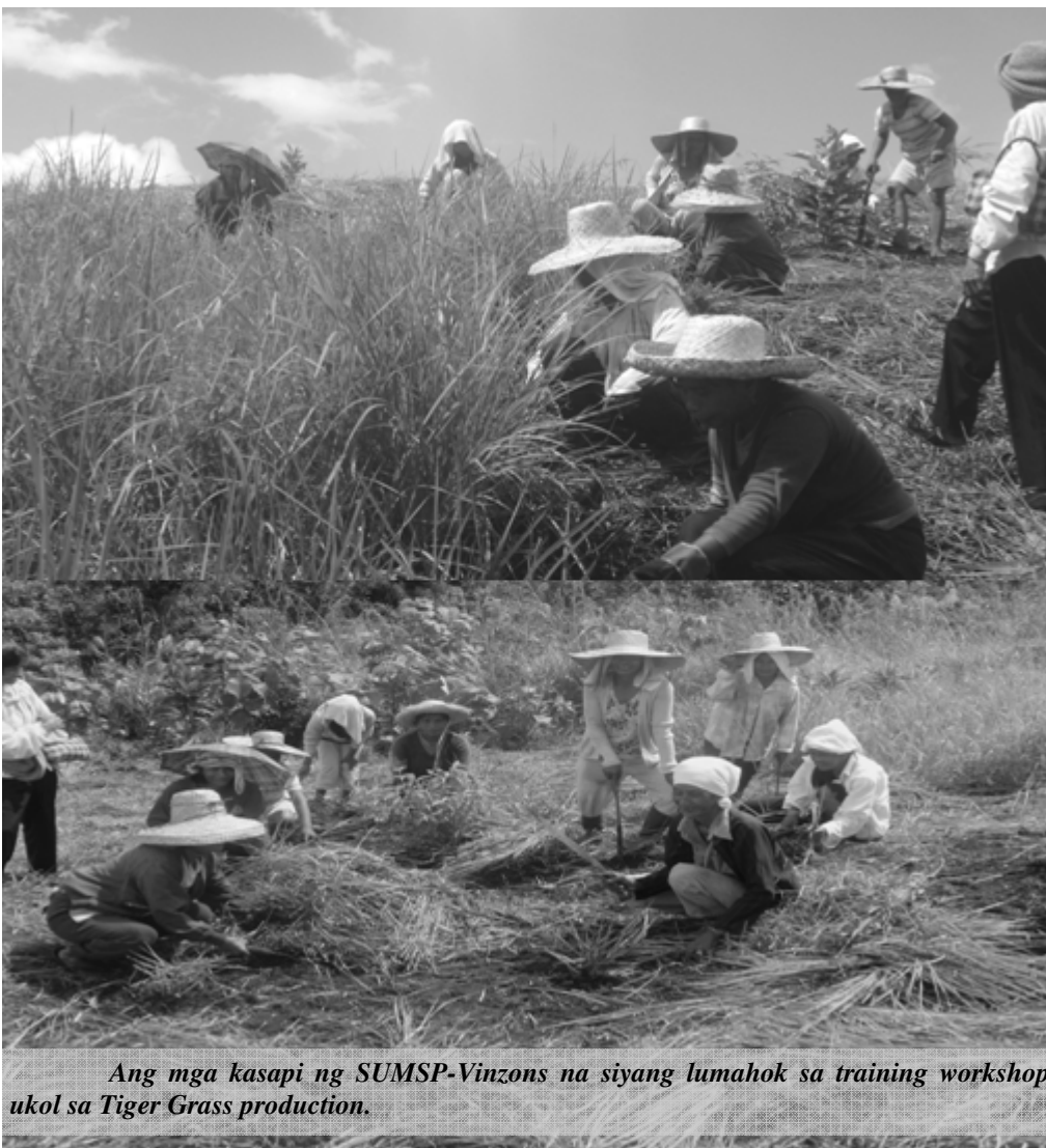
Ang mga kasapi ng SUMSP-Vinzons na siyang lumahok sa training workshop ukol sa Tiger Grass production.

Resettlement Area sa Brgy. Matacong, San Lorenzo Ruiz may ilang taon na ang nakararaan. (Gonzalo C. Binay)