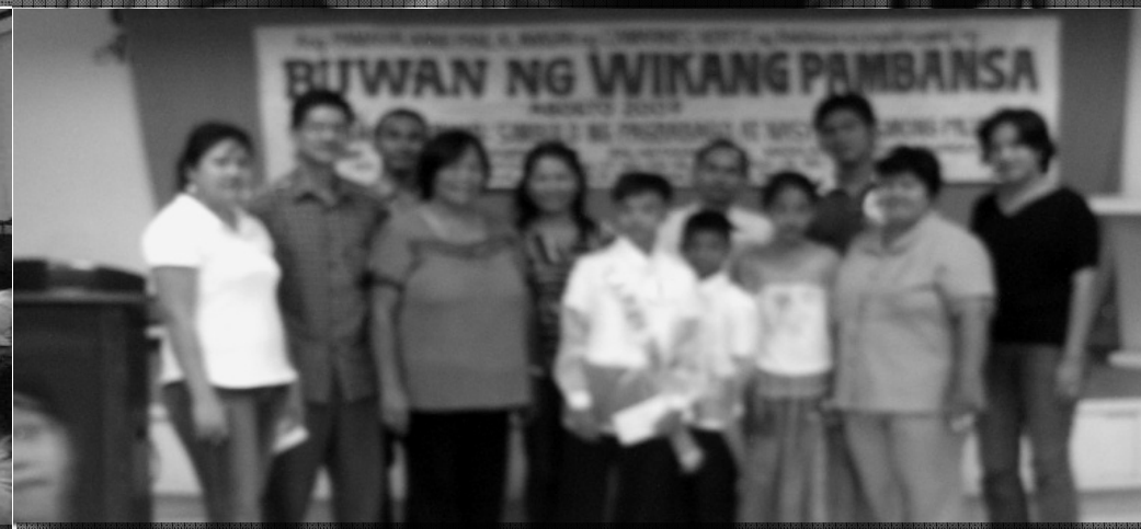
Ang mga nanalo sa Maikling Pagkukuwento kasama ang mga kawani ng Museo Bulawan at mga miyembro ng Lupon ng Inampalan at panauhing pandangal.