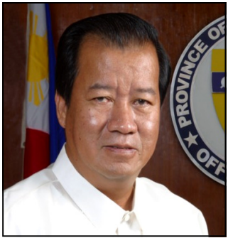
Gob. Jesus O. Typoco, Jr.

K augnay ng pagdiriwang ng Wikang Pambansa tuwing buong buwan ng Agosto ng bawat taon, ipinalabas kamakailan ng Tanggapan ng Punong Panlalawigan ang Kautusang Tagapagpaganap Blg.2009-14 na