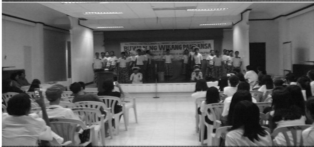
Ang Sabayang Pagbigkas na ginanap sa Audio Visual Room ng Provincial Capitol kung saan nakamit ng Mabini Colleges ang Unang Gantimpala rito.