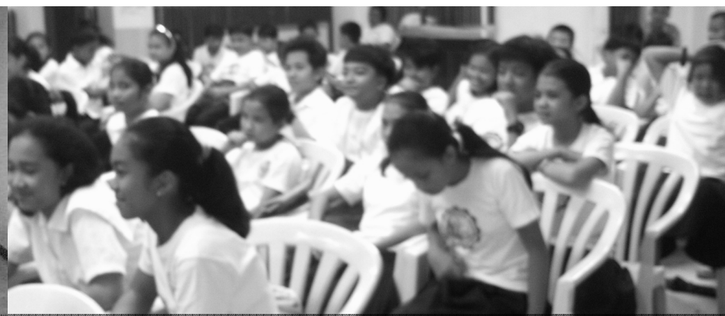
Mga mag-aaral ng Daet Elementary School habang sinasaksihan ang mga gawain sa Buwan ng Wika.