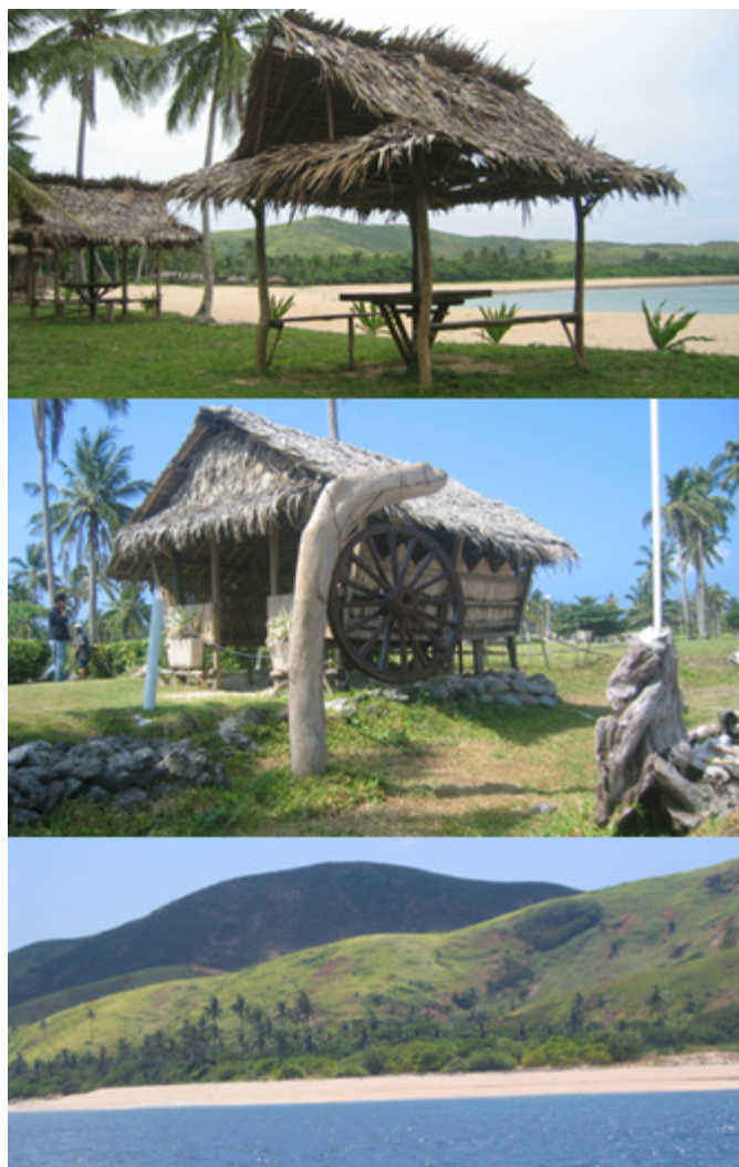
Ang tatlong larawan sa itaas ay ilan lang sa pasyalan ng mga turista sa lalawigan ng Camarines Norte. 1) Pulang-daga Beach sa Paracale; 2) Caringo Island Resort sa Mercedes, at; 3) Mahabang Buhangin Resort, Mangkawayan, Vinzons. Para sa tour arrangement, makipag-ugnayan lang sa tanggapan ng Provincial Tourism Office, Provincial Capitol, Daet, Camarines Norte, Tel. (054) 721-3087.

TAON 9, BLG. 2 DAET, CAMARINES NORTE AGOSTO, 2009 "Entered as Second Class Mail at Daet Postal Office, Daet, C.Norte" Website: http://www.camarinesnorte.gov.ph E-mail: cao_cnorte@yahoo.com