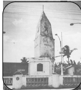
Ang pinakamatandang monumento ni Gat Jose Rizal ay matatagpuan sa Daet, Camarines Norte. (Circa 1898)

TAON 9, BLG. 1 DAET, CAMARINES NORTE HULYO 2009 "Entered as Second Class Mail at Daet Postal Office, Daet, Cam.. Norte" Website: http://www.camarinesnorte.gov.ph E-mail: cao_cnorte@yahoo.com