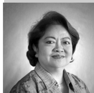
DOJ Sec. Agnes Devanadera IACAT Chairperson

A nim (6) na taon pagkatapos na maprobahan ang batas laban sa human trafficking , na sinundan