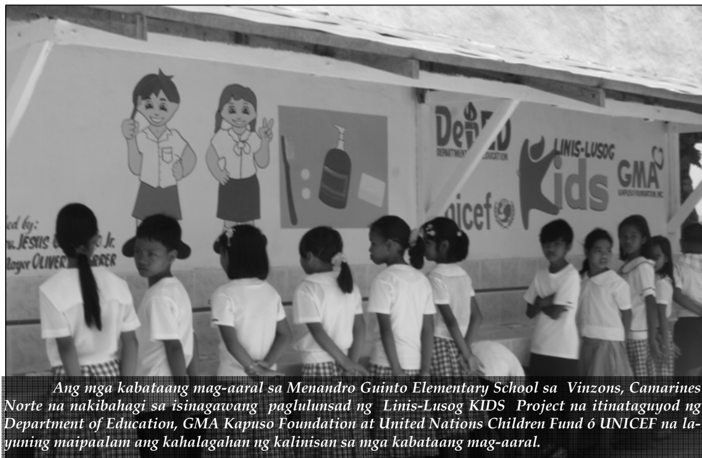
Ang mga kabataang mag-aaral sa Menandro Guinto Elementary School sa Vinzons, Camarines Norte na nakibahagi sa isinagawang paglulunsad ng Linis-Lusog KIDS Project na itinatataguyod ng Department of Education, GMA Kapuso Foundation at United Nations Children Fund ó UNICEF na layuning maipalam ang kahalagahan ng kalinisan sa mga kabataang mag-aaral.