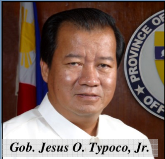
Gob. Jesus O. Typoco, Jr.