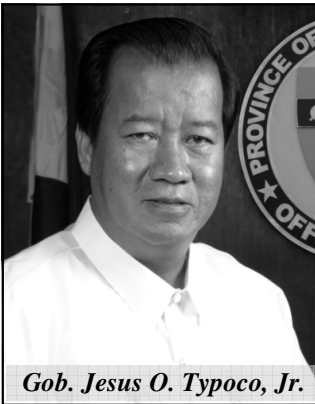
Gob. Jesus O. Typoco, Jr.