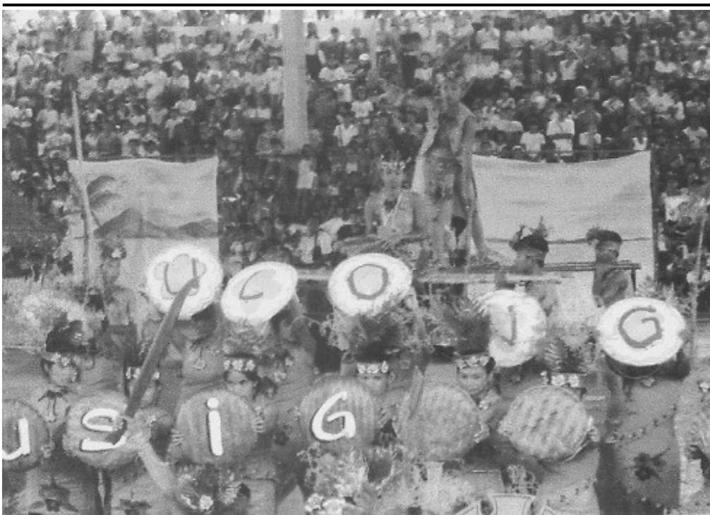
Sa nalalapit na kapistahan ng Labo, Camarines Norte , sa Mayo 6, 2009 muling itataghal ang Busig-on Festival na isang napakalaking pagdiriwang upang pasayahin ang bayang ito sa loob ng isang linggo. Inaanyayahan po ang lahat na makisaya.

Ang dalawang (2) nabanggit na proyekto ay isinagawa ng Pamahalaang Panlalawigan sa pamamagitan ng Provincial Engineering Office (PEO) at sa pakikipagtulungan ng Provincial Planning and Development Office (PPDO) at sangay ng Department of Education (DepEd) dito. (AMY LOPEZ, PPDO)