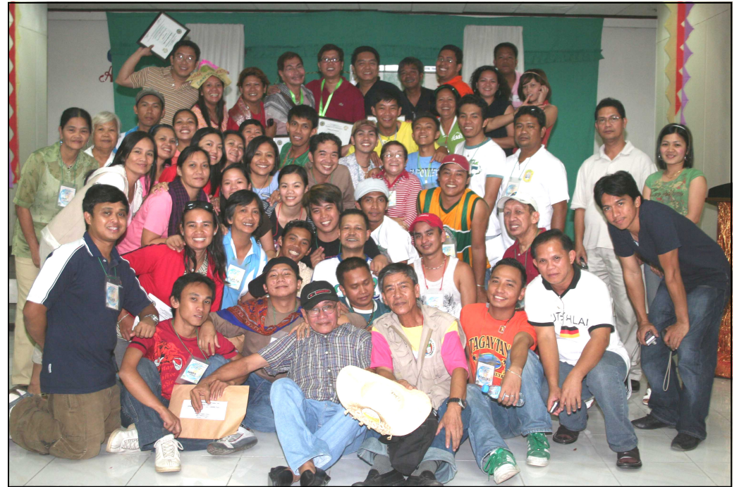
Ang mga lumahok sa isinagawang Tourism Summit kasama ang mga trainers mula sa Department of Tourism at National Commission for the Culture and the Arts gayundin ang ilang Provincial Tourism Office staff.