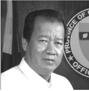
Gob. Jesus O. Typoco, Jr.