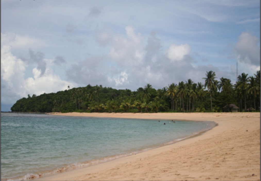
Pulang Daga Beach, Paracale, Camarines Norte