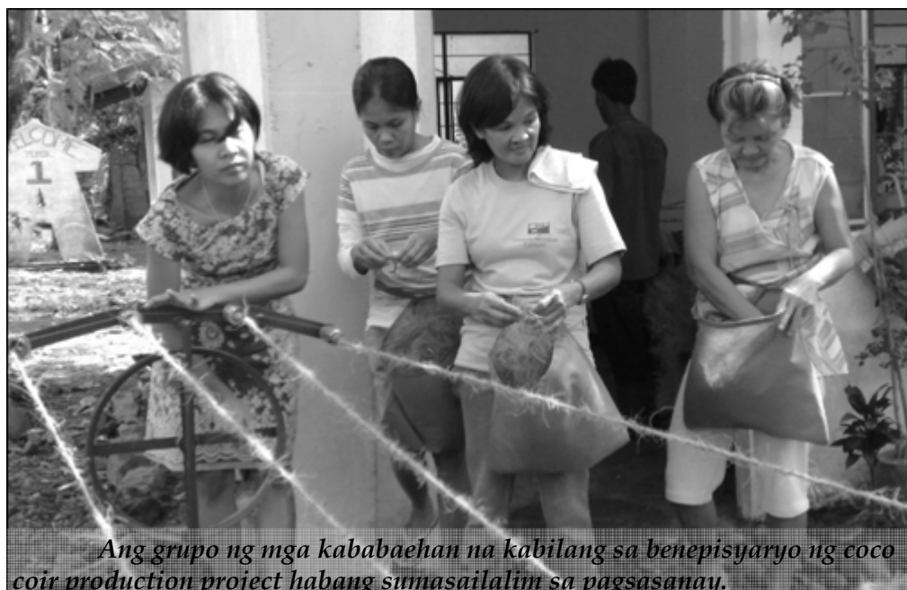
Ang grupo ng mga kababaehan na kabilang sa benipisyaryo ng coco coir production project habang sumasailalim sa pagsasanay.

Ang bahagi ng kikitain mula sa nabanggit na proyekto ay gagamitin para mabigyan ng vocational training assistance ang mga out-of-school youths (OSYs) na kwalipikadong mapagkalooban ng libreng edukasyon.