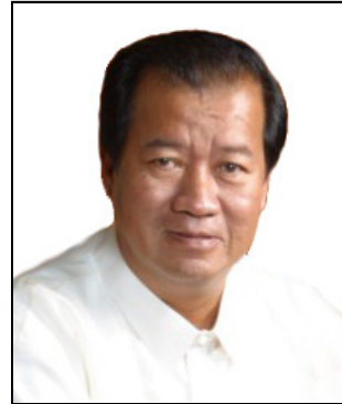
Jesus O. Typoco, Jr. Governor