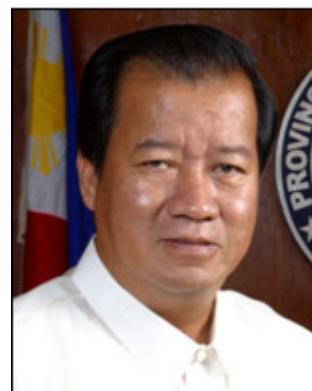
Gob. Jesus Typoco, Jr.