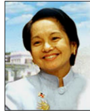
Pang. Gloria M. Arroyo