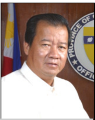
Gob. Jesus O. Typoco, Jr.

Ipinalabas ka-makailan ni Gob. Jesus O. Typoco, Jr. ang Atas Tagapagpaganap Blg. 2008-16 na nag-aatas sa lahat ng mga pambansang tanggapan, kawanihan, kagawaran, ahensya at instrumentaliti, pamahalaang panlalawigan ,at lahat na pribadong tanggapan na gamitin ang Wikang Filipino sa lahat