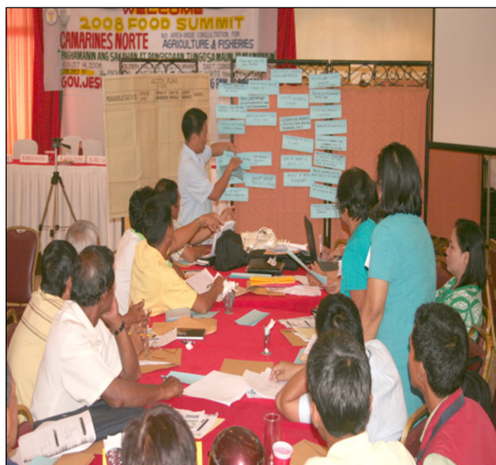
Ang isinagawang 2008 Food Summit (1st Area Wide Consultation for Fisheries and Agriculture) sa Golden Palace Restaurant, Daet ay itinaguyod ni Gob. Jesus O. Typoco Jr. at ng Sangguniang Panlalawigan, sa pamamagitan ng Office of the Provincial Agriculturist. Dinaluhan ito ng mga matataas na opisyal mula sa mga kinauukulang pamahalaang lokal at nasyonal, at mga magsasaka na siyang pangunahing katuwang ng pamahalaan upang makamit ang tema ng okasyon na, "Pagyamanin ang Sakahan at Pangisdaan tungo sa Maunlad na Kinabukasan".