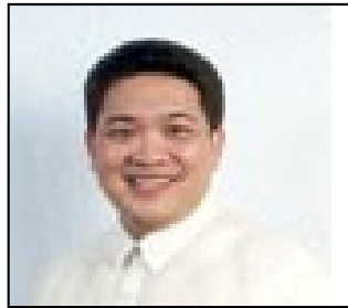
Budget Sec. Rolando Andaya

K ung nanggapa pa sa dilim ang mga manggagawa sa mga pribadong establisimyento, mistulang naka-jackpot naman ang mga empleyado ng gobyerno dahil inaasahang tataas pa ang kanilang suweldo sa 2009-2010.