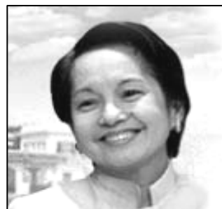
Pang. Gloria M. Arroyo

Samantala, ang mga bayan naman ng Daet, Basud, Vinzons, Jose Panganiban, Paracale at Labo na may tig-45