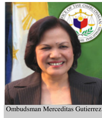
Ombudsman Merceditas Gutierrez

TAON 7, BLG. 6 DAET, CAMARINES NORTE DISYEMBRE 2007 Entered as Second Class Mail at Daet Postal Office, Daet, C. Norte Website: http://www.camarinesnorte.gov.ph E-mail: cao_cnorte@yahoo.com