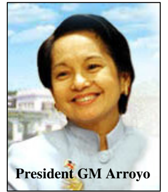
President GM Arroyo

Ang DOH ay magbibigay ng pondo para sa pagbili ng dekalidad na bakuna para sa lahat na karapatdapat na mamamayan. Ang mga LGUs naman ay magkakaloob ng pondo