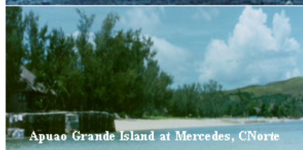
Apuao Grande Island at Mercedes, CNorte