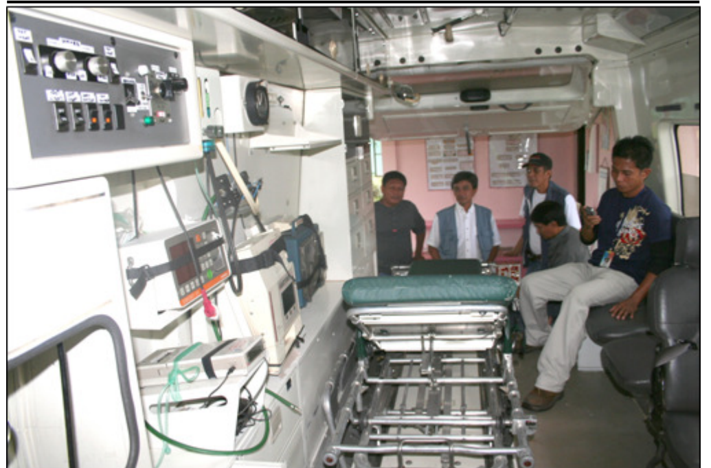
Ang Provincial Evaluators ng GPPK habang tinitingnan ang loob ng ambulansiya na kumpleto sa mga kagamitan, sa bayan ng San Vicente, kung saan nagsagawa ng evaluation ang grupo bilang bahagi ng paglilibot nila kaugnay ng Gawad Punong Panlalawigan sa Kapaligiran (GPPK).