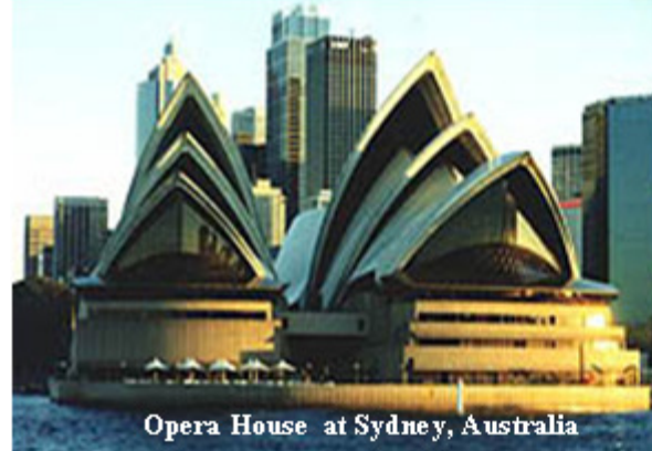
Opera House at Sydney, Australia

Kaugnay nito, ang mga potensyal na lugar-panturismo, industriya at negosyo sa lalawigan ng Camarines Norte gayundin ang mga likas na yamang lupa at dagat nito ay iprinisenta ng mga delegado ng lalawigan sa Tourism Business and Investment Meeting sa Webster Library, Black Town, Sydney, Australia