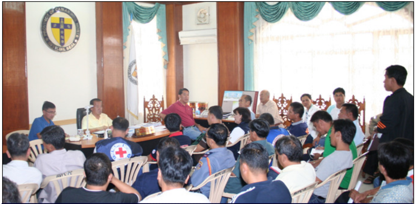
Ang Provincial Disaster Coordinating Council (PDCC) meeting na ipinatawag ni Gob. Jesus O. Typoco, Jr. kaugnay ng paparating na bagyong "Mina", kung saan pinangasiwaan mismo ng gobernador ang naturang pagpupulong na dinaluhan ng iba't-ibang kinauukulang ahensiya ng pamahalaan, mga iba pang pamahalaang lokal sa lalawigan, mga civic organizations at ilang mga NGO's na nakahandang maglaan ng tulong kung sakaling sasalantain ng bagyo ang lalawigan.