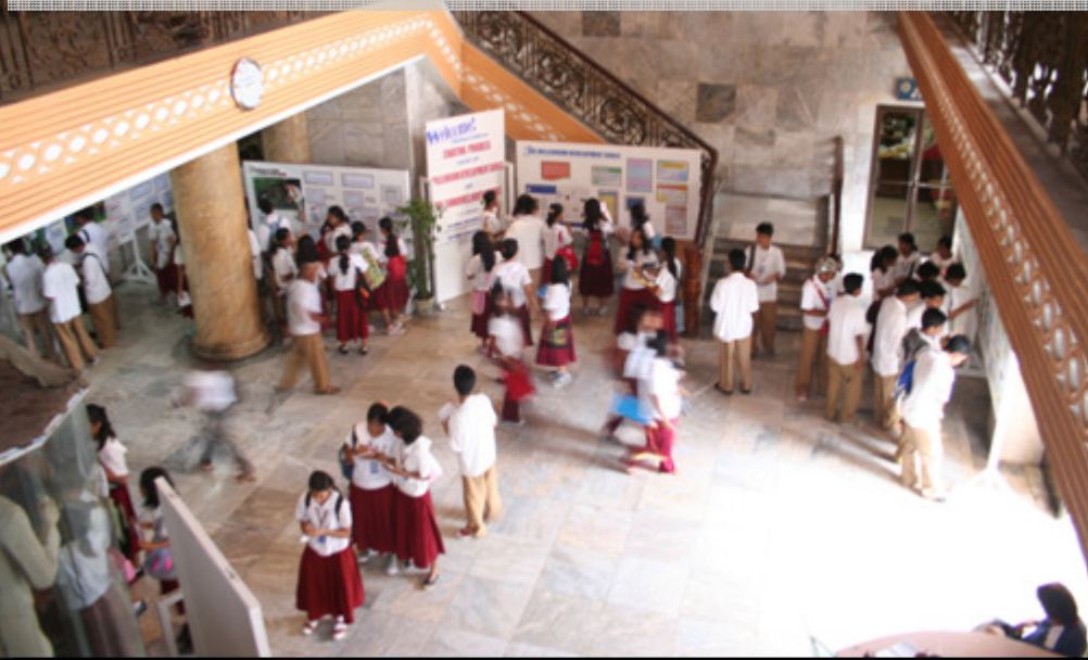
Ang ilan sa mga mag-aaral na bumisita sa Statistical Exhibit at Gallery of Good Practices sa provincial capitol lobby. Ito ay kaugnay ng selebrasyon ng National Children's Month at National Statistics Month.

Nabatid naman ng publiko ang iba't-ibang programa at proyektong makabata na naipatupad at isinasagawa ng pamahalaan ng panlalawigan sa ilalim ng Sixth Country Programme for Children (CPC 6) sa pamamagitan ng mga larawan na itinampok sa naturang gallery. Ang CPC 6 ay itinataguyod ng United Nations Children's Fund (UNICEF) at sinusuportahan ng mga kinauukulang pambansang ahensya, panlalawigang tanggapan at pribadong sektor. MARILYN P. ASIS