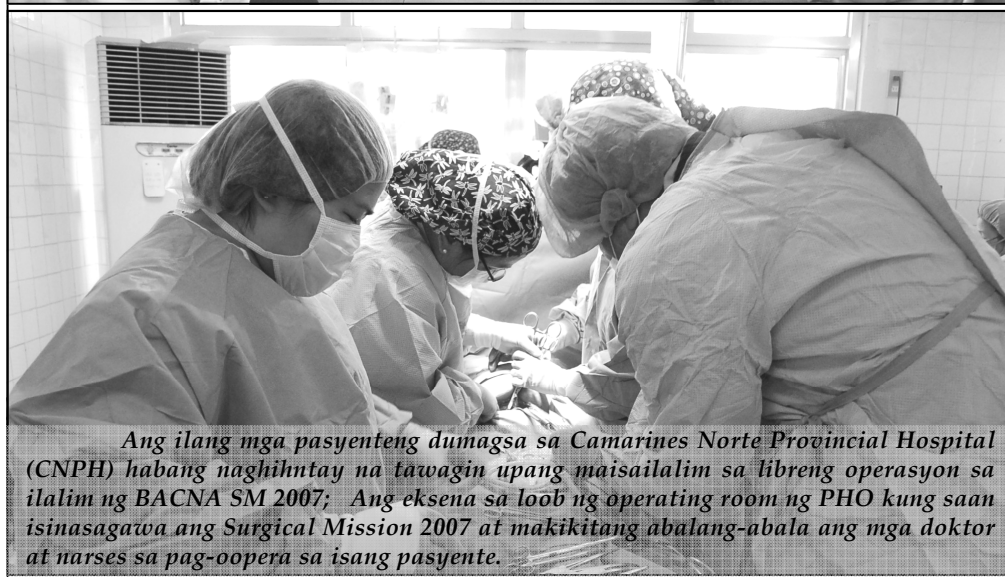
Ang ilang mga pasyenteng dumagsa sa Camarines Norte Provincial Hospital (CNPH) habang naghihintay na tawagin upang maisailalim sa libreng operasyon sa ilalim ng BACNA SM 2007 ; Ang eksena sa loob ng operating room ng PHO kung saan isinasagawa ang Surgical Mission 2007 at makikitang abalang-abala ang mga doktor at narses sa pag-oopera sa isang pasyente.